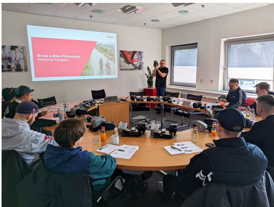
Beim ersten von zwei Terminen empfing Brose acht Auszubildende und einen Lehrer zur Schulung