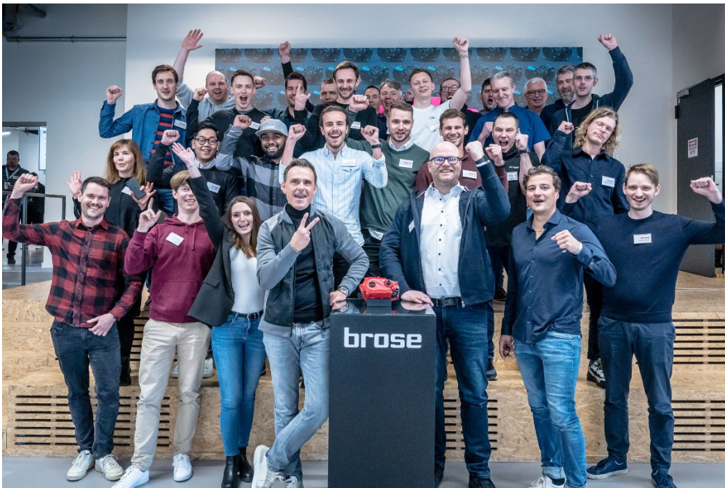
Das Brose-Team freut sich über den großen Erfolg.

Brose Antriebstechnik GmbH & Co. Kommanditgesellschaft, Berlin